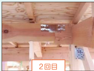
2回目 上部躯体検査