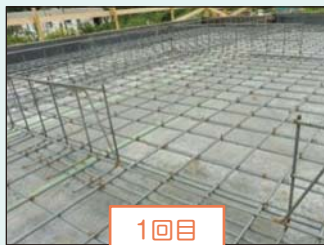
1回目 基礎配筋検査